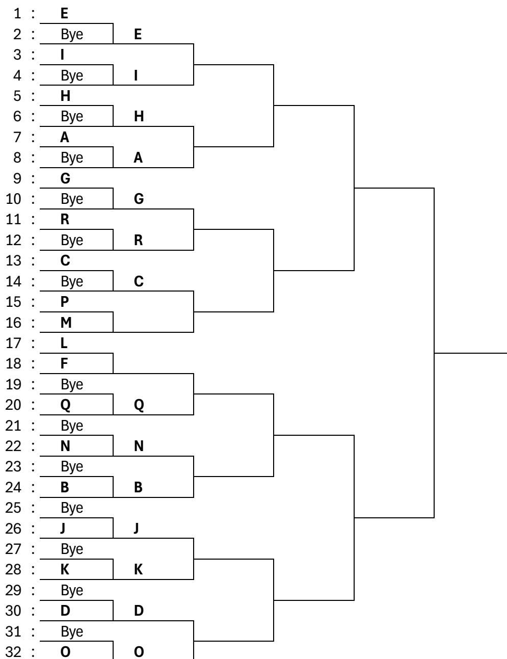
FIGUUR 4 AFVALSYSTEEM MET 18 DEELNEMERS, WAARVAN 4 GEPLAATST

Daarna worden de andere deelnemers ingeloot op de overblijvende plaatsen in het schema. Het resultaat van deze exercitie is te vinden in bovenstaande figuur. Merk op dat de deelnemers die de eerste ronde een bye hebben, in deze figuur ook al meteen in de tweede ronde zijn ingevuld.