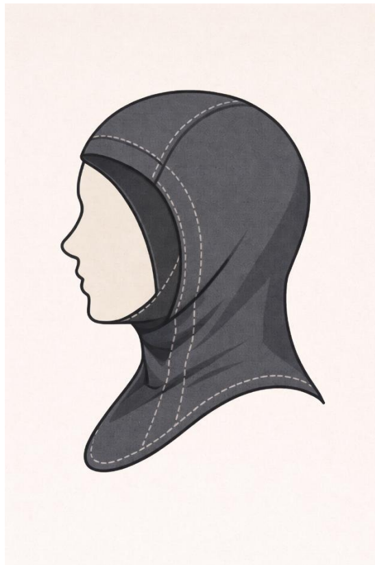
Afbeelding 2: Illustratie van een sporthijab.