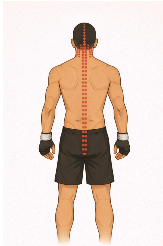
Afbeelding 4: Zones van het lichaam waar niet op mag worden gestoten of getrapt (aangegeven met rode stippen).

gedefinieerd als het gebied dat begint bij de kruin van het hoofd en recht naar beneden loopt over de middenlijn van het hoofd, met een afwijking van één inch (ongeveer 2,5 cm) aan beide zijden. Ook het volledige achterste gedeelte van de nek mag niet worden aangevallen. Dit gebied loopt vanaf de overgang van schedel naar nek (occipitale overgang) tot aan de bovenkant van de trapeziusspier. Vanaf de trapeziusspier loopt de beschermde zone verder langs de wervelkolom tot aan het stuitje.